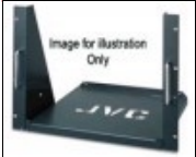
RK-A140E MONTAGGIO A RACK PER TM A140PN