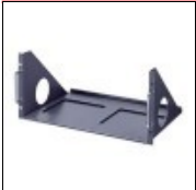
RK-C101E MONTAGGIO RACK X TM-A101G