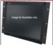
RK-C179L2EA Rack Mount, TM-19L2D, LM-H191